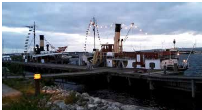
Aftenstemning og godt med blæsevejr!

Barkasselaug og Fregattens venner havde arrangeret både morgenmad og frokost til alle både Fredag, Lørdag og Søndag (ren luksus) i et telt ved siden af Kystens Perle, Barkasselaugets lokale på Museets område. Fredag blev stævnet 'Fregatten for fuld damp' åbnet med kanonsalut og tale af borgmesteren. Derefter sejlads fredag eftermiddag, lørdag og søndag. Pga det noget kølige og blæsende vejr, var der en del mennesker på kajen, men ikke ret mange at sejle med. Lørdag aften var der gris på grillen og hyggeligt samvær i teltet til sent. Ebeltoft's vartegn, de syngende vægtre, kom besøg og sang for os både lørdag og søndag.