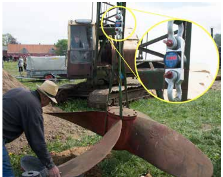
Konkurrencen: Gæt skruens vægt!

Græsted Veterantræf er efterfølgende splittet op i to. Et fortsat træf i Græsted og et nyt Veterantræf i pinsedagene, 3.-5. juni, nær Hundested. Det ny træf hedder "TimeWinder" med undertitlen: Nostalgi til lands, til vands og i luften. Træfpladsen ligger ved det skønne Grønnesegaard Gods lige ud til Roskilde Fjord og der indbydes til deltagelse også af veteranskibe og -fly. Det betyder derfor at vi har mulighed for at deltage med fjordsejls med damperen til næste år.