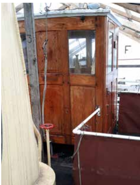
Styrhuset uden sokkel.

Så håber vi, at når forårets første regnskylle kommer, for det gør den jo nok, at vi kan sidde i tørvejr i maskinrummet.