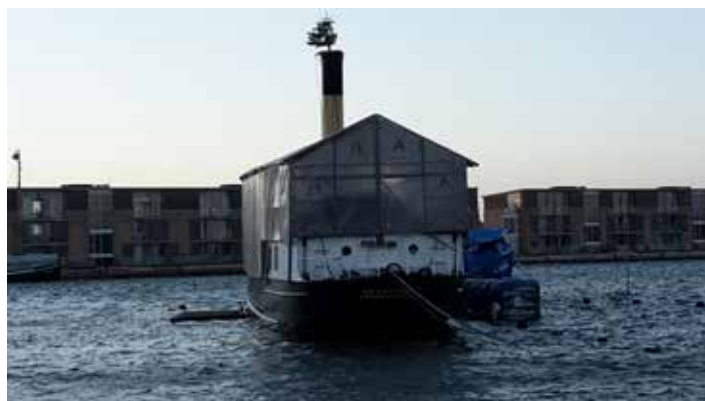
Høj-vande i havnen efter "Urd's" visit. Tirsdag 27. december 2016.

Foreningen til Gamle Skibes Bevarelse - Dansk Veteranskibsklub ønsker jer alle et Godt Nytår.