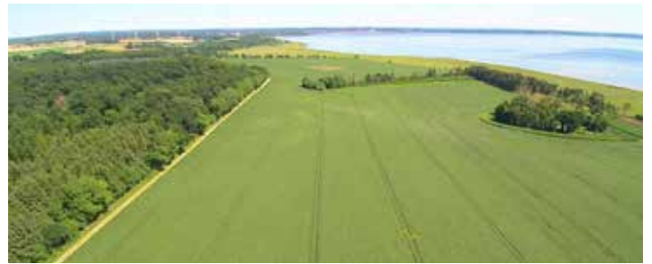
TimeWinder's kommende træfplads ligger lige ud til Roskilde Fjord :-)

Græsted Veterantræf er efterfølgende splittet op i to. Et fortsat træf i Græsted og et nyt Veterantræf i pinsedagene, 3.-5. juni, nær Hundested. Det ny træf hedder "TimeWinder" med undertitlen: Nostalgi til lands, til vands og i luften. Træfpladsen ligger ved det skønne Grønnesegaard Gods lige ud til Roskilde Fjord og der indbydes til deltagelse også af veteranskibe og -fly. Det betyder derfor at vi har mulighed for at deltage med fjordsejls med damperen til næste år.