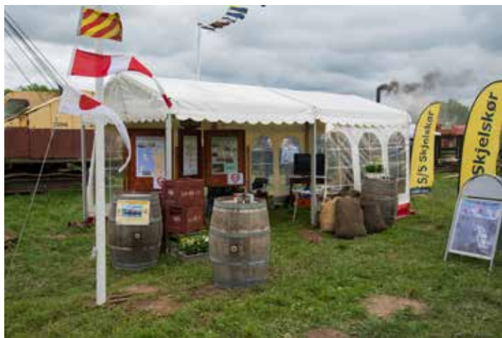
Foreningens stand på træffet i Græsted. Vi lå placeret i området "Græsted Havn" i fint selskab med chaluppen "Frøya" og Dampbarkas No 30.

De efterfølgende år har træffet vokset sig større og større, både med hensyn til udstillede maskiner/biler og antal besøgende. Så Foreningen syntes vi skulle prøve at være med endnu en gang. I pinsen 2016 deltog Foreningen med en stand, hvor vi både viste film og solgte lidt merchandise. Vejret var desværre noget koldt, alligevel besøgte over 16.000 personer træffet. Vi havde lavet en konkurrence om at gætte vægten på Skjelskør og Bjørn's skruer, som blev lidt af et hit. De heldige vindere fik direkte besked og deres præmie udleveret – en sejltur med Skjelskør (hvad ellers !!)