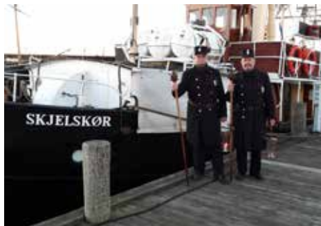
Ebeltofts vægtre besøgte os på kajpladsen.

Oprindeligt havde vi forestillet os at sejle fra Frederikssund onsdag formiddag, men vejr-guderne var ikke i ordentlig humør: Der blæste en strid vind, som det ikke var fornuftigt at sejle ud i. Torsdag så meget bedre ud i vejrudsigten, så der blev sejlet fra Frederikssund ved middagstid og efter en fin sejlads over mod Jylland, fik vi Hjelm i sigte som noget af det sidste i dagslys. Resten af sejladsen ind til Ebeltoft foregik i mørke og ved projektørens hjælp fandtes alle bøjer og afmærkninger ind til Ebeltoft Havn. En spøjs ting observeret fra vandet: Når kl. bliver 01:00, så slukkes ALT lys i Ebeltoft by, al gadebelysning m.m. forsvandt og dermed også nogle af vores pejle-punkter. Nå, vi fandt vej helt ind til fregathavnen og lagde os til at sove. S/S Bjørn var ankommet nogle timer før Skjelskør.