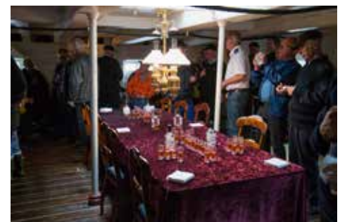
Fregatdram på fregatten.