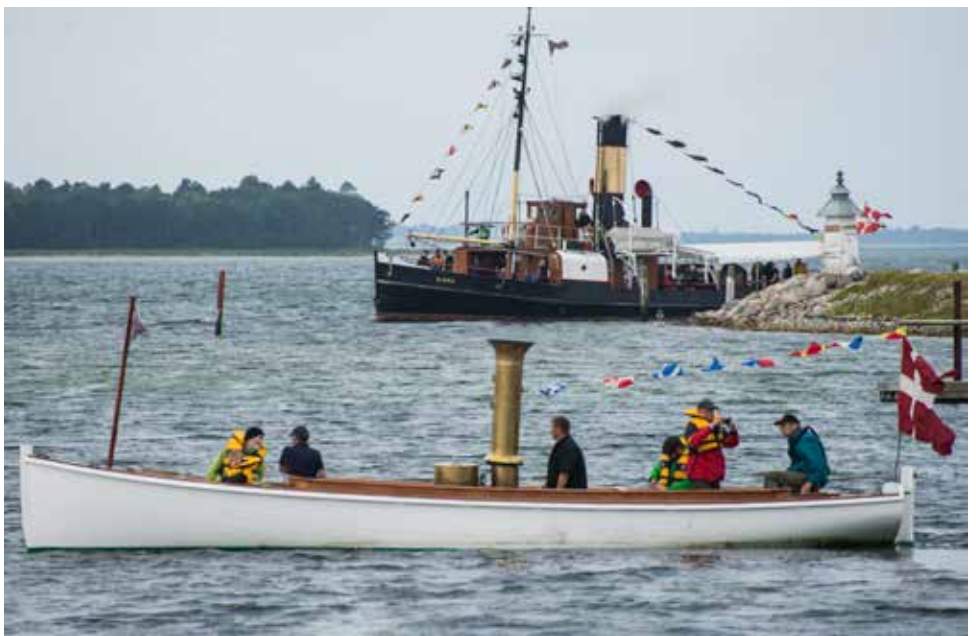
Et par Dampskibs-kolleger: Dampbarkas No 30 og S/S Bjørn i Ebeltoft.