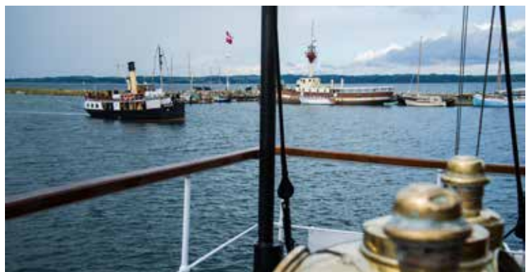
S/S Skjelskør – set fra S/S Bjørn.